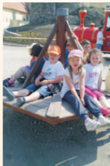
...za kolektiv mateřské školy Ivana Peksová

19. června se naši „školáci“ vydali na výlet do Znojma. S batůžky a dobrou náladou jsme zdolali tuto trasu: kolem kostela sv. Michala (děti srovnávaly velikost s kostelem sv. Josefa v Jevišovicích), ulicí Veselou (vyzkoušeli jsme chůzi po „kočičích hlavách“), nádhernou vyhlídkovou „Jižní cestou“ kolem rotundy sv. Kateřiny ke znojemskému hradu. V hradním příkopu jsme obdivovali vystavené dravce. Při čekání na turistický vláček jsme si pohráli na kolotoči a houpačkách, pojedli svačinku a smlsali dobrotkami od maminky.