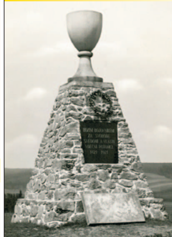
Pomník po dokončení roku 1924

V letošním roce si připomínáme 90 let od postavení husitského pomníku zvaného Kalich na vrchu Žalově nad přehradou.